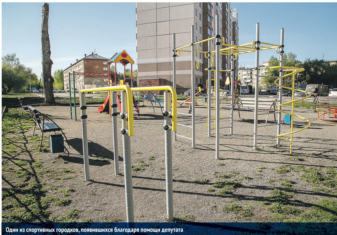
Один из спортивных городков, появившихся благодаря помощи депутата