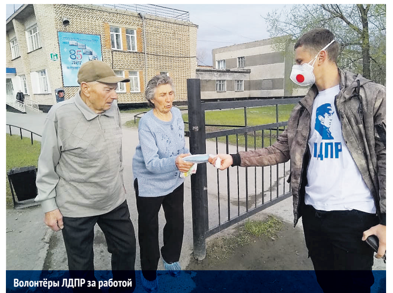
Волонтеры ЛДПР за работой